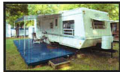
Plate-forme de bois d'une superficie maximale de 23,78 mètres carrés sans excéder la superficie de plancher de l'équipement principal. Elle est installée le long de l'équipement principal. Le patio est préassemblé en sections de 1,2 mètre sur 2,4 mètres de côté, et doit demeurer mobile et temporaire et non habitable et non attaché au sol et/ou à l'équipement de camping, utilisé accessoirement à l'équipement de camping.